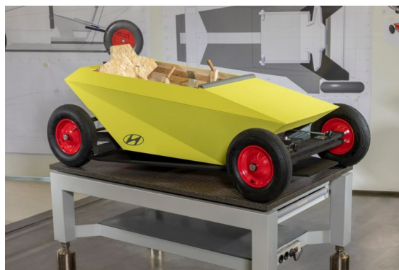
Conception et réalisation de « caisses à savon »