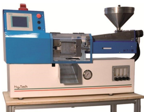
Conception et fabrication d'une Presse à injecter